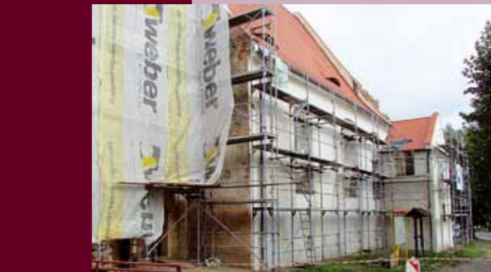
▲ Pozdně gotický krov lodi. Obnova exteriéru.