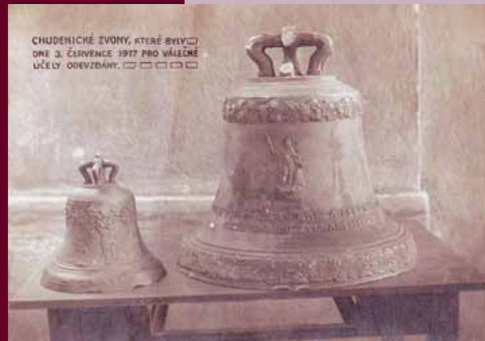
▲ Historické zvony.