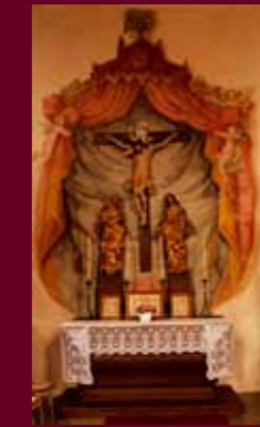
▲ Iluzivní freska na stěně s dřevěnou Kalvárií z roku 1759. ▼ Nový misijní kříž při vchodu do kostela.

Ze zařízení kostela je pozoruhodná kamenná křtitelnice ze 17. století ve tvaru rýhované polokoule na kuželovitém dřívku a masivní dřevěná okovaná kasa. Nejvýznamnější památkou kostela značně umělecké a kulturní hodnoty je původní pozdně gotická třídílná archa s predelou z počátku 16. století. Objednatelem tohoto díla byl královský hodnostář Vilém Czernin z Chudenic a jeho bratr Jan, pravděpodobně u pražského malíře Šimona Lába, domnělého domácího umělce Czerninů, který v malostranském domě Viléma Czernina učinil roku 1512 závěť. Na rubu archy jsou vyobrazeni čtoucí sv. Ondřej a apoštol Jakub s klečícím donátorem z rodu Czerninů. V presbytáři je umístěna malba na plátně „Oplakávání Krista“ z konce 15. století – střední obraz zavíracího oltáře z hradní švihovské kaple.