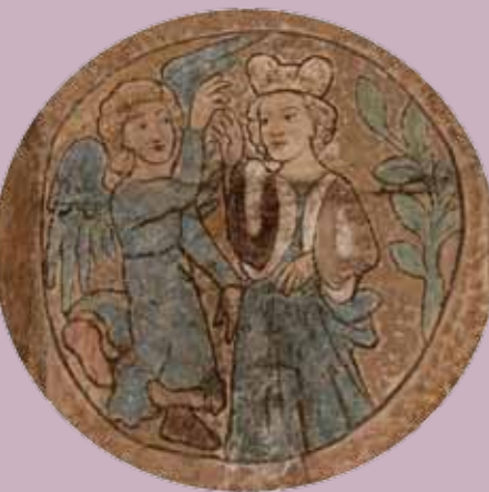
▲ Detail výzdoby triumfálního oblouku – zřejmě Adlétu Mišeňská v ráji s andělem.