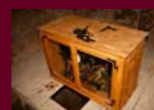
▼ Práce v interiéru.