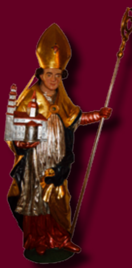
▲ Plastika sv. Wolfganga. ▼ Sv. Václav na jednom dílu pozdněgotické archy.

Ve stavebně nejstarší části dominuje triumfální kamenný oblouk s gotickými malbami z poloviny 14. století, které se nalézají i pod přemalbami stěn, zejména v presbytáři. Na téměř celé ploše oblouku jsou figurální malby v okrouhlých polích. Středověkým stylizovaným rukopisem jsou zobrazeny ženské postavy (světice) a muži ve zbroji – podle heraldiky a lemujícího textu předci Czerninského rodu. Na severní stěně se nalézá fragment testamentu Heřmana Czernina z Chudenic z roku 1650, pořízený zde pro paměť budoucím pokolením.