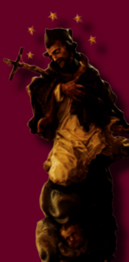
▲ Polychromovaná plastika sv. Jana Nepomuckého. ▼ Svatý Kryštof přenášející malého Ježíše Krista přes řeku na třetím dílu archy.