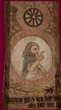
▲ Výzdoba triumfálního oblouku pochází z poloviny 14. století. ▼ Zakladatel kostela Czernin.

Historickému centru Chudenic dominuje gotický farní kostel svatého Jana Křtitele. Podle nápisu na stěně kostela jej v roce 1200 založil Drslav, bratr Czernina a Břetislava z Chudenic. První dochovaná písemná zpráva o Chudenicích však pochází až z roku 1291 a kostel byl zřejmě založen po postavení sousední tvrze – rodového sídla Czerninů (Starý zámek).