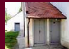
▲ Proměny kostela – vstup na věž. ▼ Obnovený historický hodinový stroj.