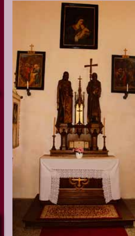
▼ Oltář sv. Cyrila a Metoděje.