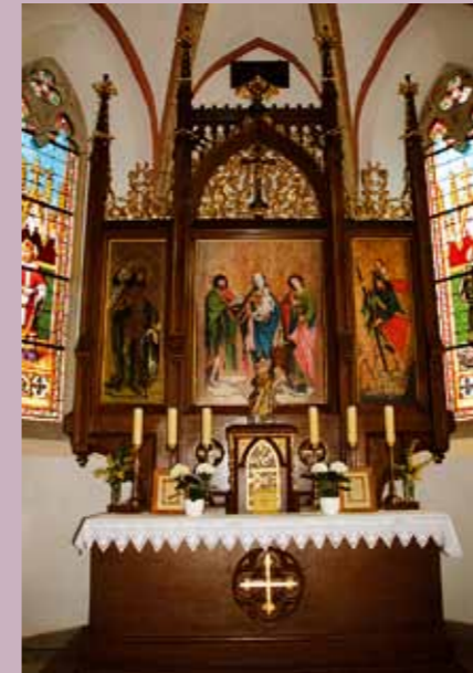
▼ Pseudogotický hlavní oltář s gotickou třídílnou archou.