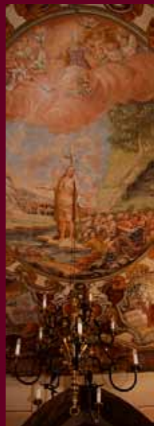
▲ Stropní freska s výjevy ze života sv. Jana Křtitele.