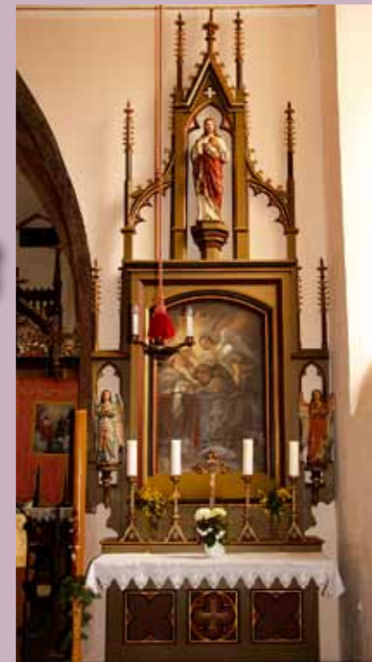
▲ Zrestaurovaný boční oltář sv. Antonína Paduánského.

Ze zařízení kostela je pozoruhodná kamenná křtitelnice ze 17. století ve tvaru rýhované polokoule na kuželovitém dřívku a masivní dřevěná okovaná kasa. Nejvýznamnější památkou kostela značně umělecké a kulturní hodnoty je původní pozdně gotická třídílná archa s predelou z počátku 16. století. Objednatelem tohoto díla byl královský hodnostář Vilém Czernin z Chudenic a jeho bratr Jan, pravděpodobně u pražského malíře Šimona Lába, domnělého domácího umělce Czerninů, který v malostranském domě Viléma Czernina učinil roku 1512 závěť. Na rubu archy jsou vyobrazeni čtoucí sv. Ondřej a apoštol Jakub s klečícím donátorem z rodu Czerninů. V presbytáři je umístěna malba na plátně „Oplakávání Krista“ z konce 15. století – střední obraz zavíracího oltáře z hradní švihovské kaple.