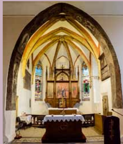
▲ Presbytář kostela.

V roce 1906 byl chrám povýšen na děkanství, o šest let později byl zvelebován interiér – obnovuje se chór a osazují se nové varhany. Cenné deskové obrazy chudenicického oltáře byly průběžně restaurovány. Poslední oprava vnitřních prostor byla provedena včetně nového elektrického vedení v roce 1983.