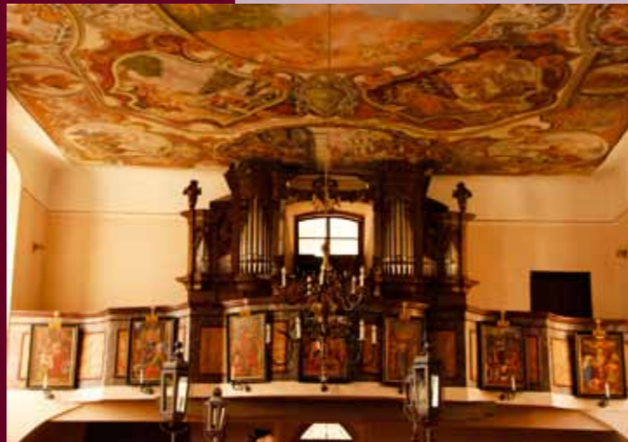
▲ Kůr s varhany a obrazy křížové cesty. ▼ Kostel je dominantou Chudenic i okolní krajiny.

Kostel sv. Jana Křtitele je jednodílná stavba s hranolovou věží v západním průčelí, pětibokým presbytářem na východní straně a se sakristií a předsíní na severní straně. Podvěžní vstupní prostor je sklenut křížovou hřebinkovou klenbou, vstupní portál je hrotitý s profilovaným ostěním. Loď je plochostropá, presbytář je sklenut křížovou žebrovou klenbou na kružbových konzolách s maskarony. Hrotitá okna jsou zakončena kružbami doplněnými v 19. století. Při jižní straně presbytáře je oratoř a při severní stěně sakristie sklenutá valenou klenbou.